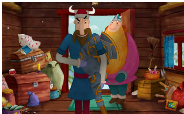
Wiking Tappi 2