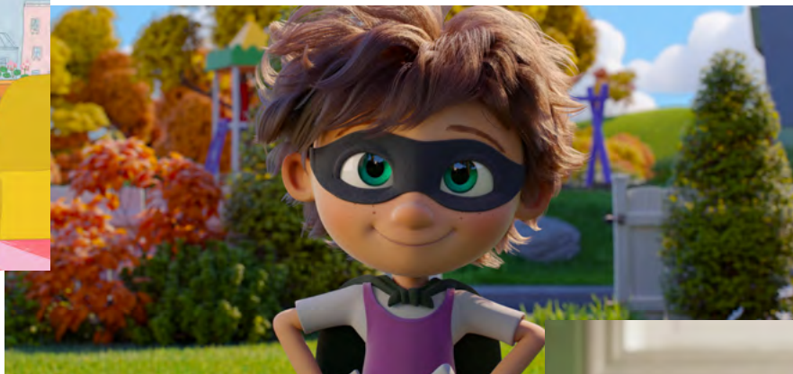
Ella Bella Bingo