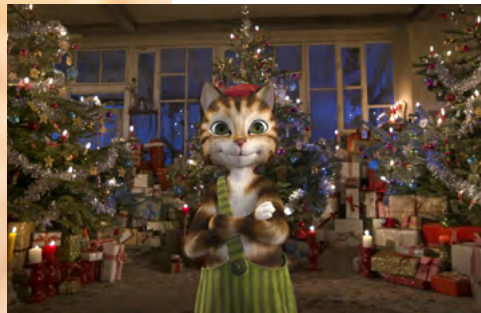
Pettson i Findus – najlepsza gwiazdka