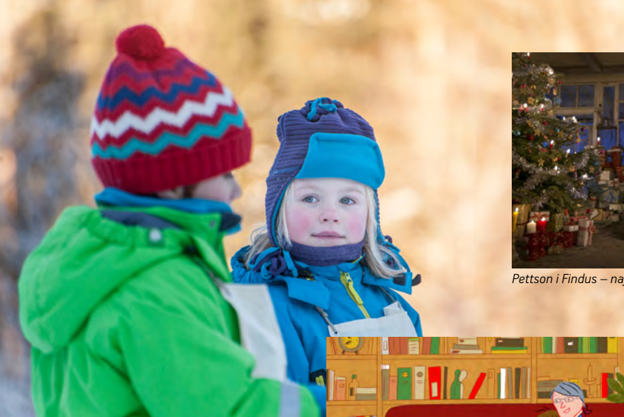
Kacper i Emma zimowe wakacje